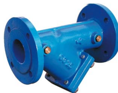
obj. č. 17.3 čistící kus s filtrem

Poznámka: Dodržuj osazení čistícího kusu s filtrem po směru toku vody (viz. značka) a síto orientované směrem dolů.