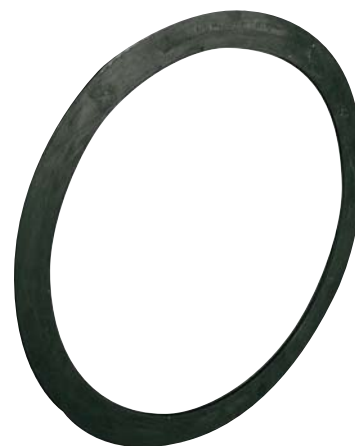
obj. č. 17.4.1 přírubové těsnění obj. č. 17.4.2 přírubové těsnění s ocelovou výztuhou

VOD-KA si vyhrazuje právo měnit data sloužící k technickému pokroku výrobků.