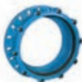
DN 450 a větší